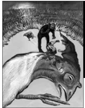
Separate sick turkeys : Illustration de Susan Coe. Abattage des dindes malades après séparation.

De fait, s'il y a des différences radicales à établir dans le réel, elles ne résident pas dans les oppositions entre naturel et humain, naturel et social, naturel et artificiel, inné et acquis 14 , etc. D'un point de vue scientifique, philosophique tout autant qu'éthique, ce n'est pas cette distinction entre supposés « êtres de liberté » et « êtres de nature » qui semble désormais pertinente, mais bien plutôt celle entre une matière sensible et une matière inanimée, entre ces choses réelles qui éprouvent des sensations, qui dès lors ressentent des désirs et de ce fait agissent en fonction de fins qui leur sont propres, et ces autres choses qui n'éprouvent rien, n'ont pas d'intérêts, auxquelles rien n'importe, qui ne donnent aucune valeur aux événements et aucun but à leur existence. Entre les êtres sensibles et les choses insensibles, entre les animaux, pour faire vite, et les cailloux ou les plantes. Plus encore que l'existence d'une conscience réflexive, le « simple » fait que la matière puisse dans certains cas se révéler capable d'éprouver des sensations est d'ailleurs une impressionnante énigme, et l'explication de ce mystère sera sans doute le défi que devront relever les sciences au cours de ce siècle naissant.