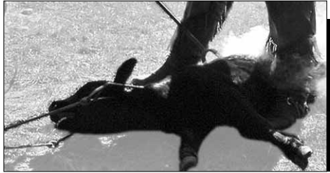
L'appropriation : on marque au fer les animaux comme on marquait les Noirs et les femmes les siècles précédents (illustrations page 7).

« ne pas traiter comme un simple moyen pour parvenir à nos fins » ? Généralement, la réponse est : les êtres humains, alors qu'elle devrait logiquement être : tous ceux pouvant pâtir de ces comportements. Il y a peu de sujets où une « différence naturelle », en l'occurrence d'espèce 10 , est utilisée avec aussi peu de précautions comme frontière morale. Pour ceux que l'on a ainsi exclus, on admet non seulement que leur bien se confond avec « ce que la nature a prévu pour eux », mais on l'assimile au besoin avec ce à quoi ils nous servent : les chats sont faits pour attraper les souris, les moutons pour être tondus et les poulets pour être rôtis.